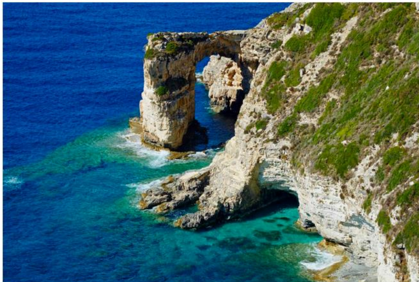
Die spektakuläre Küste von Paxos lässt sich am besten per Boot erkunden

Der sprichwörtliche Star des Ionischen Meeres ist bekanntermaßen Korfu. Die Insel, auf der die österreichische Kaiserin Sisi ein Schloss erbauen ließ, ist unter anderem bekannt für die üppige Natur und die venezianische Architektur. Mit Paxos und Andipaxos verfügt Korfu über zwei interessante Nachbarn. Paxos beeindruckt insbesondere durch hohe Klippen und verschlungene Küstenhöhlen, die sich per Boot am besten erkunden lassen. Kleiner als Paxos ist nur noch Andipaxos mit einer Länge von lediglich drei Kilometern. Nur etwa 40 Menschen leben hier dauerhaft, und Besucher finden hier wahres Aussteiger-Feeling.