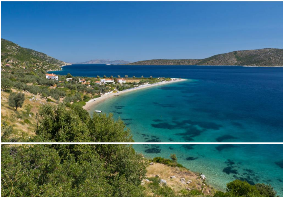
Ein Strand auf Alonissos. Die Insel gehört zu den Sporaden und liegt nicht weit entfernt von Skiathos.

Von TRAVELBOOK | 09. März 2018, 15:49 Uhr